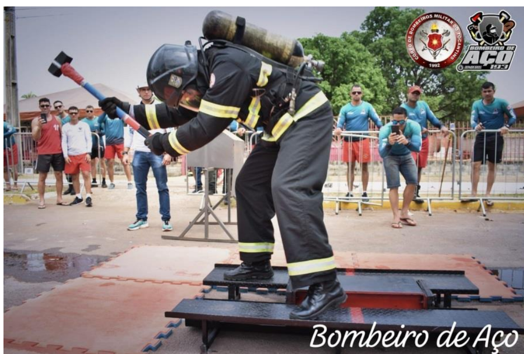
Figura 3 – Competição Bombeiro de Aço do CBMTO, entrada forçada.