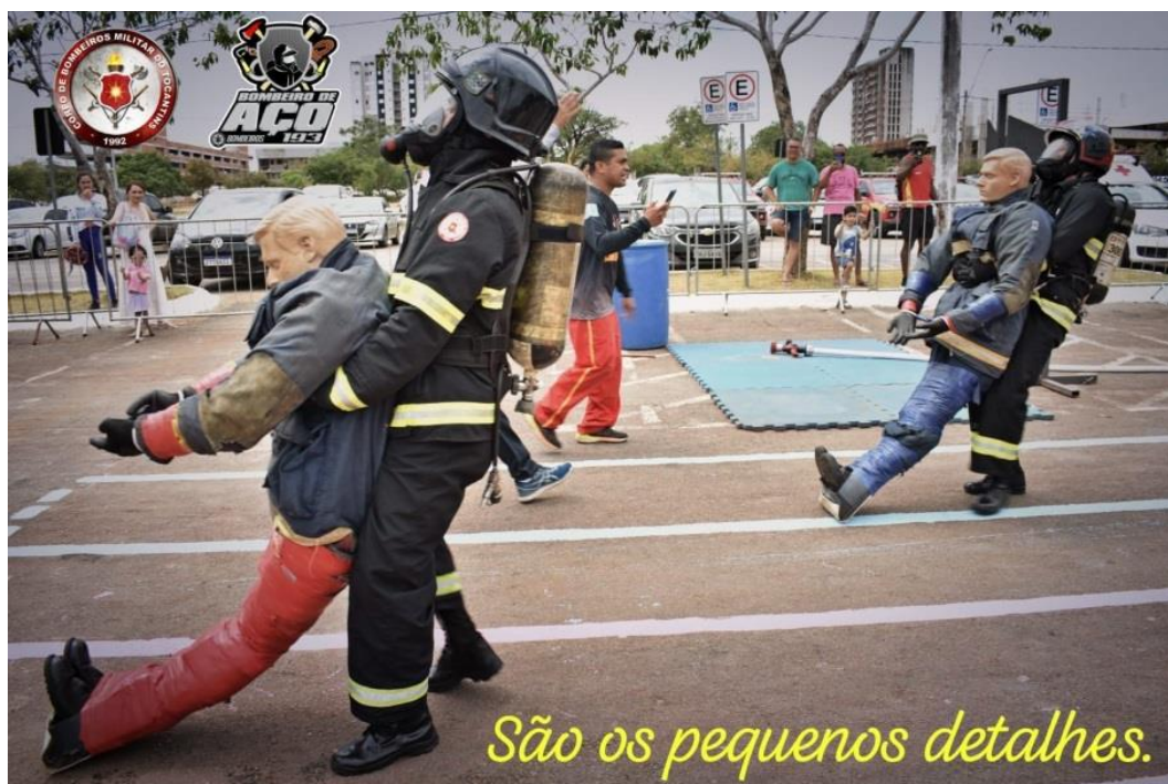
Figura 5 – Competição Bombeiro de Aço do CBMTO, resgate de vítima.

O(A) competidor(a) deverá arrastar um manequim/boneco de até noventa quilogramas pelo trajeto designado e deverá utilizar a técnica australiana, com os braços passados sob as axilas do manequim, podendo cruzar as mãos sobre o peito, e deslocará caminhando de costas até a linha de chegada, sendo proibido o arraste pelas vestimentas do manequim ou a utilização de quaisquer outras técnicas.