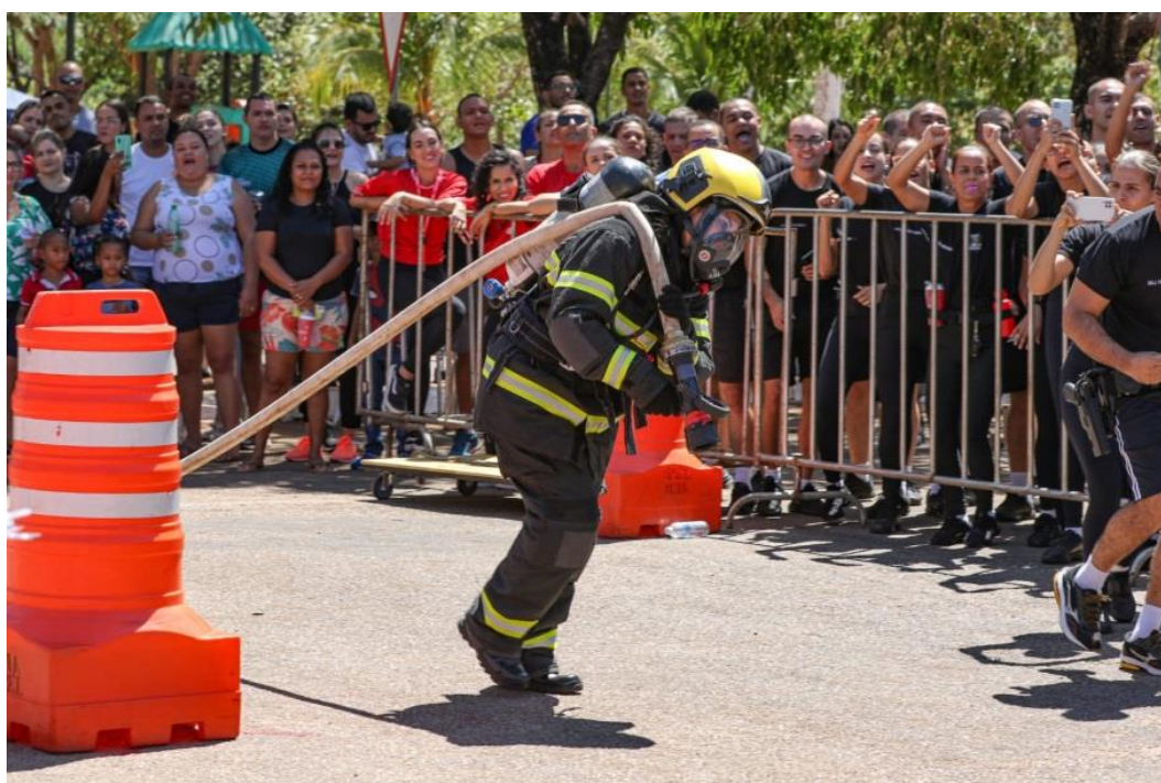
Figura 4 – Competição Bombeiro de Aço do CBMTO, arraste de mangueira.

O(A) competidor(a) pegará uma mangueira pressurizada de 1½ polegadas, que deverá ser arrastada sobre o ombro ao longo do percurso definido, em sentido contrário ao último deslocamento, passará por uma porta de duas folhas, modelo vai-e-vem, extinguirá o fogo, colocará o esguicho sobre o tapete designado e partirá para a última fase.